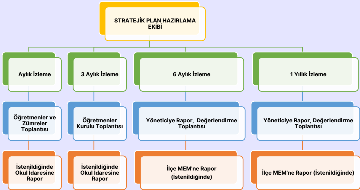
Şekil 1 İzleme ve Değerlendirme Süreci Şeması

İzleme-değerlendirme raporu, istenildiğinde İlçe Milli Eğitim Müdürlüğüne gönderilecektir.